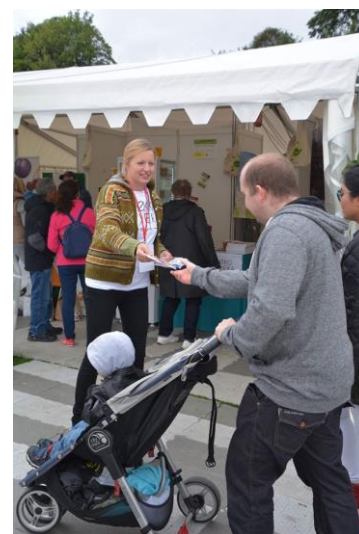
Oikos Vest på Bergen Matfestival!