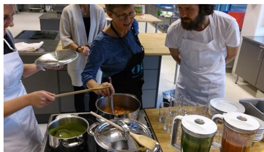
Økoveka 2015, Smaksverkstad

Styret vedtok at Økoveka (Økouka elles i Norge) skulle vere satsingsområde. Økouka vart første gong halden i Oslo og har etter kvart spreitt seg til Trondheim og Stavanger og er ein viktig møteplass for både forbrukarar, produsentar og andre relaterte næringer. Det var styret som tok initiativ til å kalla arrangementet her vestpå "Økoveka" og fekk gjennomslag for dette på sentralt hald.